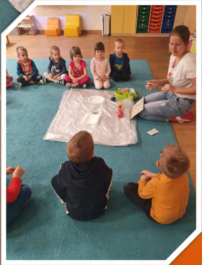
Następnie zbarwiliśmy wodę na niebiesko i zaczęliśmy obserwować eksperyment z deszczową chmurą.