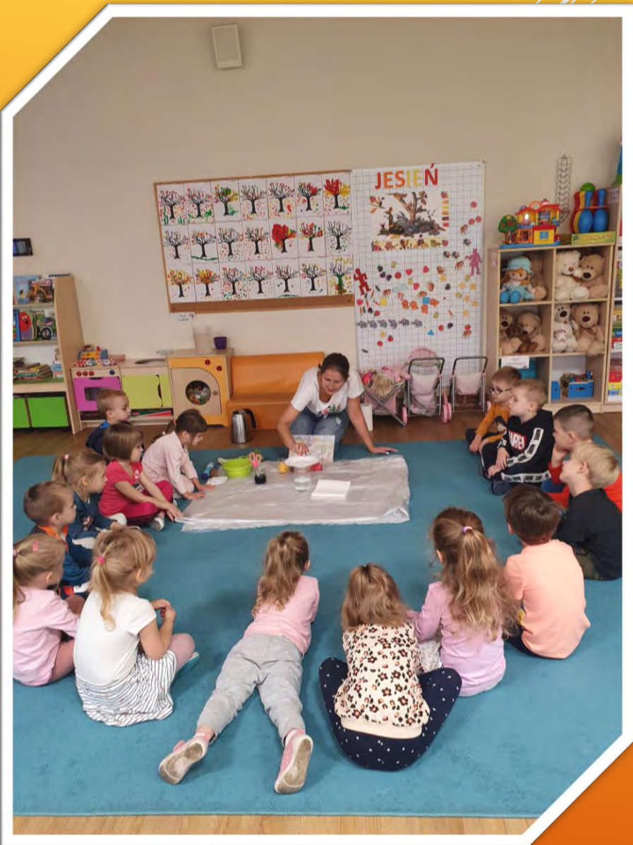
Na początku nastąpiło zapoznanie ze zjawiskiem powstawania deszczu.