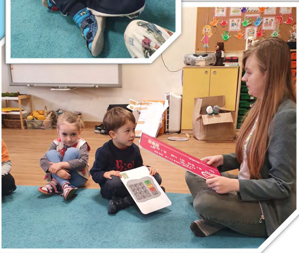
Zapoznali się z wyglądem różnych banknotów i monet.