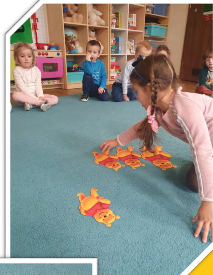
Szeregowaliśmy również misie od największego do najmniejszego