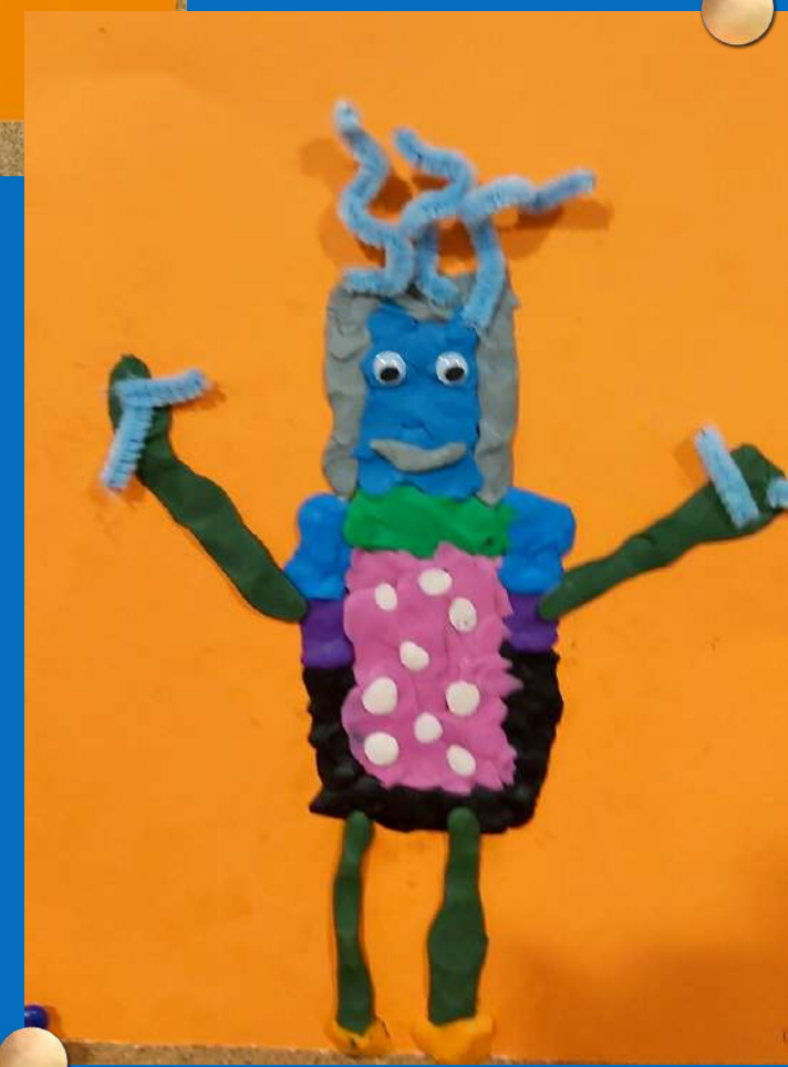
To była cenna przygoda dla wszystkich Artystów.