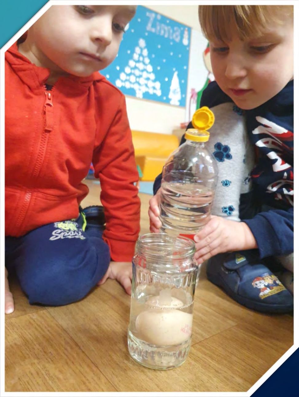
Podczas kolejnych zajęć w ramach realizacji innowacji pedagogicznej „Mali odkrywcy w świecie żywności” stworzyliśmy gumowe jajo.