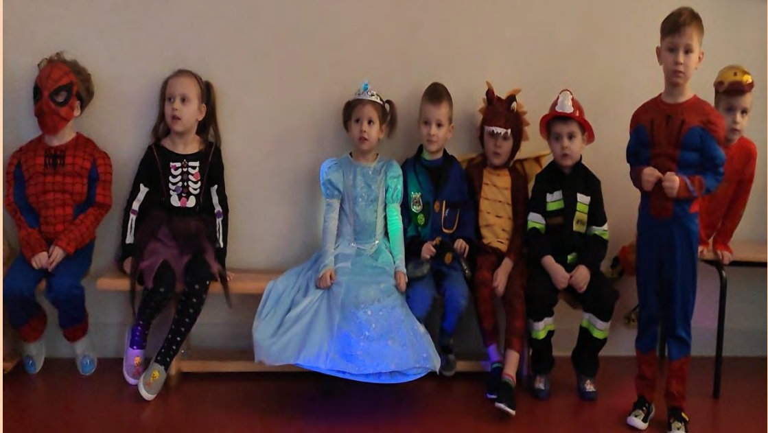
Po prezentacji strojów, idziemy na salę balową.