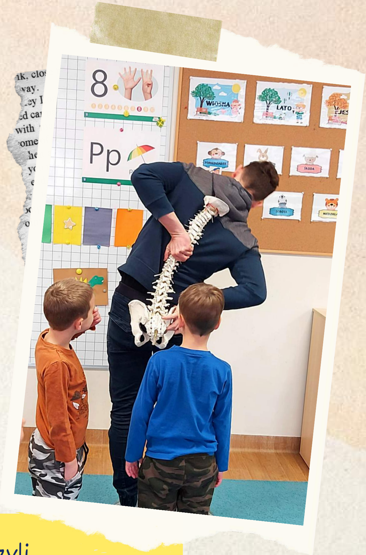
Artyści na własne oczy zobaczyli jak ich kręgosłupy zachowują się podczas gimnastyki.