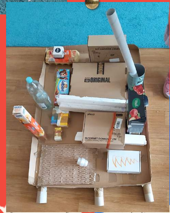
To tylko niektóre nasze dzieła.