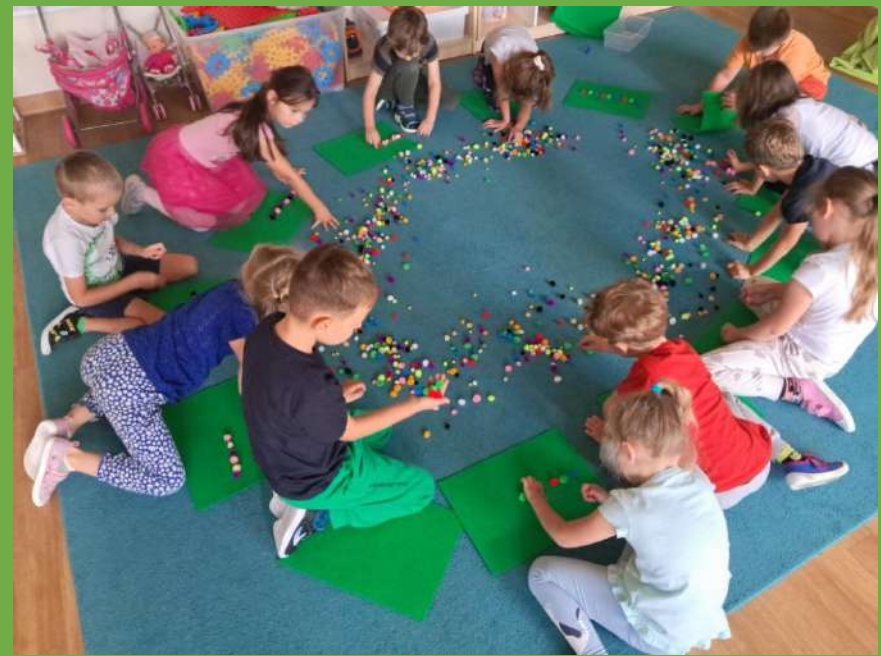
W trakcie zabaw z pomponami doskonaliliśmy umiejętności: przeliczania, rozróżniania strony lewej i prawej, tworzenia zbiorów według określonych kryteriów, kontynuowania kolorowych sekwencji i stosowania liczebników porządkowych.