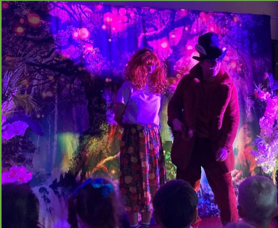
Obejrzeliśmy spektakl teatralny „Piotruś i Hela w Krainie emocji”