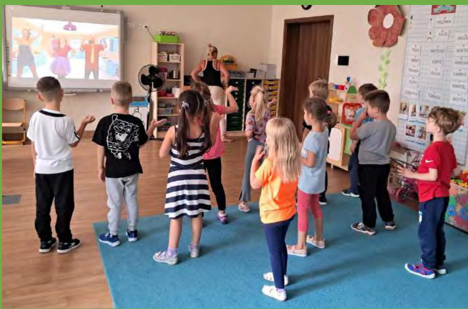
Rozwijaliśmy sprawność ruchową podczas zabaw tanecznych .